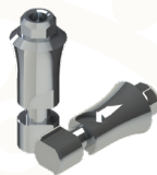
Análogo SO 100730AP