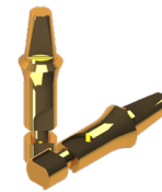
Análogo Pilar Sólido