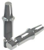
Análogo CI 100730CI